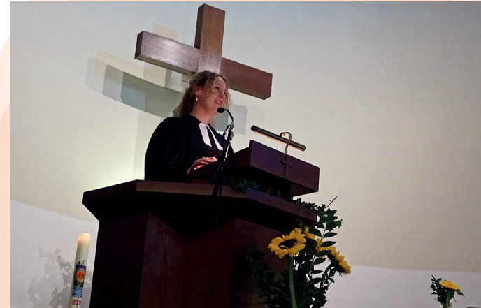
Pfarrerin Friedrichsdorf bei der Predigt

Die Amtseinführung fand am 10.09.2023 statt und war ein schöner Festtag für die Gemeinde und ihre Gäste!