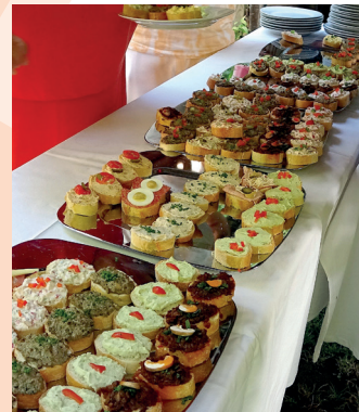
Für Speis und Trank war reichlich gesorgt