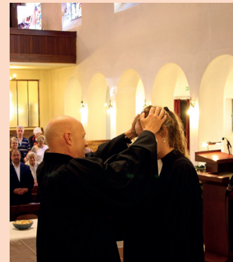
SI Geist segnet die neue Pfarrerin