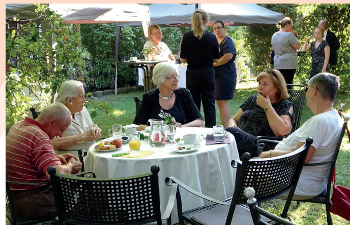
Bei der gemütlichen Feier im Garten