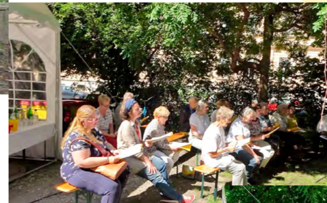
Kaffee und Kuchen, eine Kinder-Schnitzeljagd, Sing along im Garten und ein Grätzelspaziergang sowie viele Gespräche und Begegnungen fanden am Nachmittag statt.