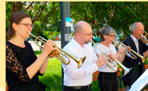
Die Wiener Chormädchen (oben) und der Diözesaner Posaunenchor "Oekumenobrass" (unten)